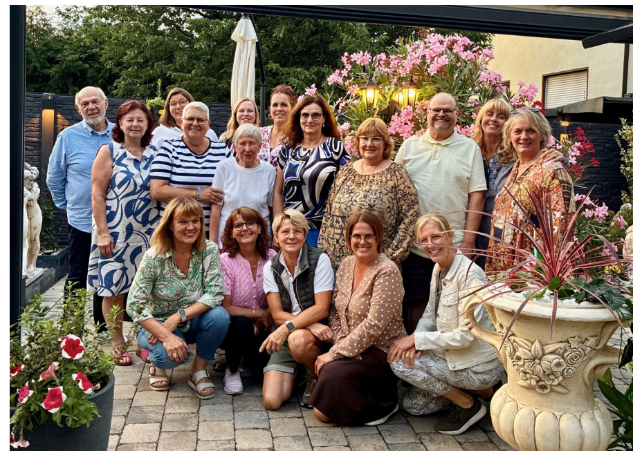
Zu sehen sind eine Auswahl unserer Ehrenamtlichen und Vorstandsmitglieder auf dem Sommerfest des Vereins 2025

Wir freuen uns darauf, Sie kennenzulernen und Ihnen in dieser besonderen Lebensphase zur Seite zu stehen.