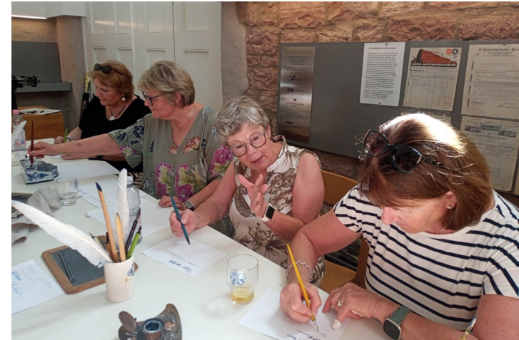
Im Handschuhsheimer Füllfedermuseum

Am 28.05. machten wir eine Fahrt nach Kraichtal-Unteröwisheim ins Event Café des CVJM. Nach gemütlichem Kaffeetrinken mit ganz leckeren Kuchen und Torten, durften wir uns auf das Thema „Frühling“ einlassen. Wir wurden überrascht mit wunderschönen Fotos aus der Natur, mit Gedichten und Rätseln. Das Singen kam natürlich auch nicht zu kurz. An diesem stimmigen Nachmittag durften wir Gottes Schöpfung hautnah spüren.